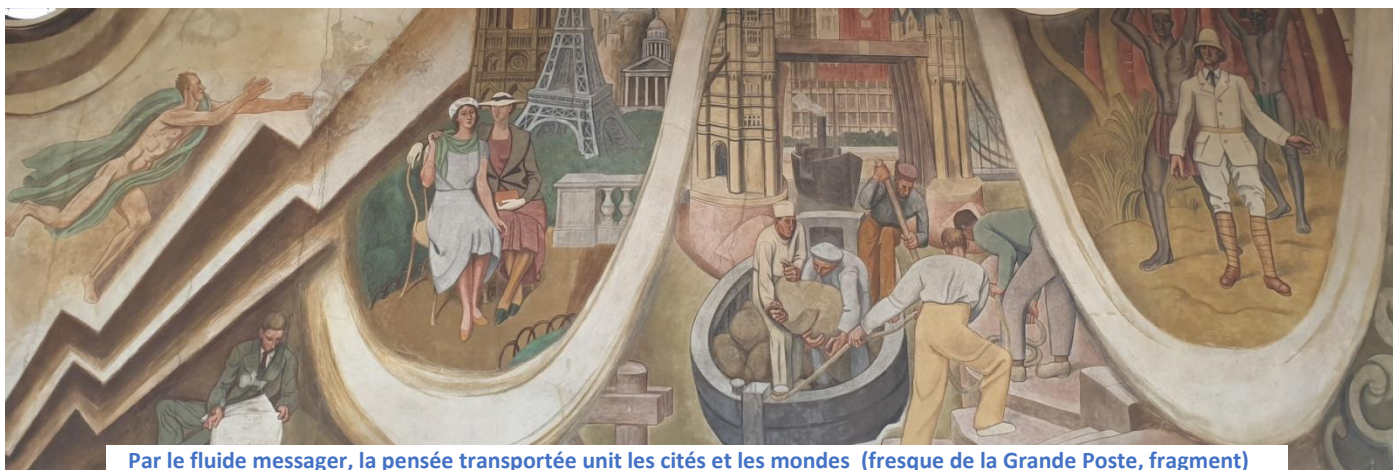
Par le fluide messager, la pensée transportée unit les cités et les mondes (fresque de la Grande Poste, fragment)