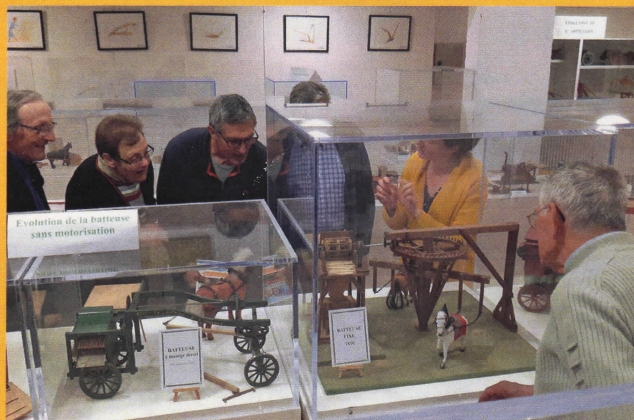
Vitrines animées de scènes de battage